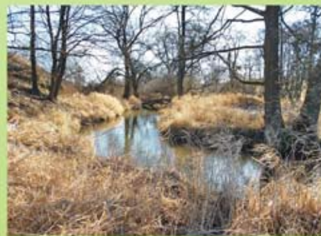
Meandry Balinky v klidové zóně.

Devětsíl lékařský ( Petasites hybridus Linné) je vytrvalá rostlina z čeledi hvězdicovitě. Je to léčivá rostlina. Není ohroženým druhem naší flóry.