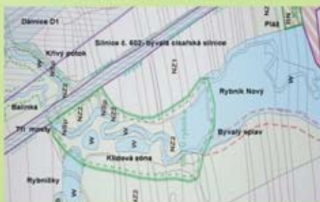
Klidová zóna na Balince nad rybníkem Nový.

Devětsíl lékařský ( Petasites hybridus Linné) je vytrvalá rostlina z čeledi hvězdicovitě. Je to léčivá rostlina. Není ohroženým druhem naší flóry.