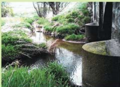
Soutok Balinky s Křivým potokem.

Pérovník pštrosí ( Matteuccia struthiopteris ) je druh kapradiny řazený v současnosti do čeledi onokleovitě. Tato vzrůstná kapradina vytváří souvislé porosty na vlhkých a stinných stanovištích a můžeme jej nalézt na soutoku Nadějovského a Řehořovského potoka. V ČR označen jako ohrožený druh.